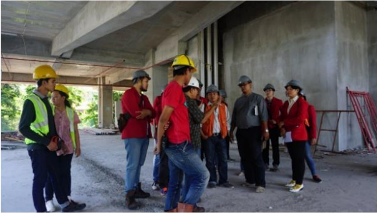
Kunjungan proyek pembangunan One East Residences, kontraktor PT. TATA MULIA