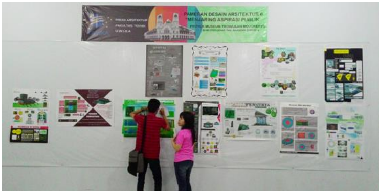
Pameran Konsep Perancangan Studio Desain Arsitektur 6 yang mengangkat berbagai tema untuk museum di Trowulan, Mojokerto